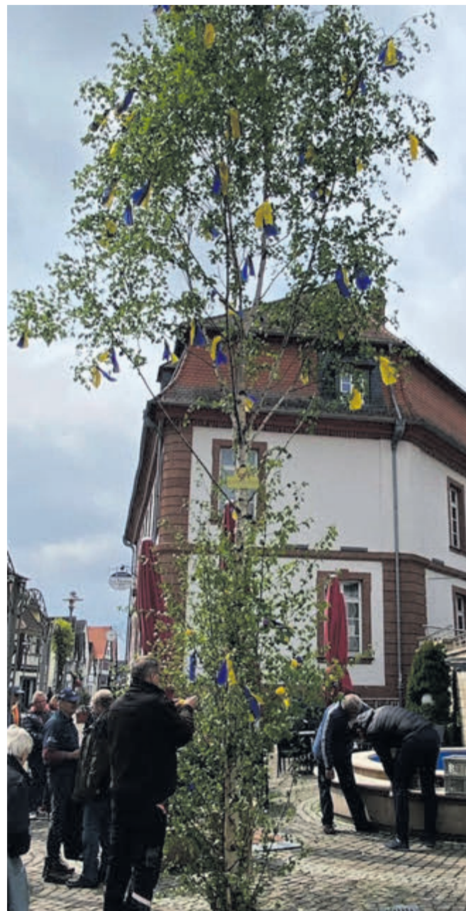
Der Maibaum in seiner vollen Pracht.