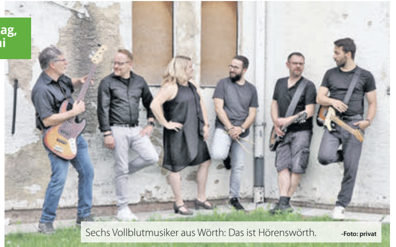
Sechs Vollblutmusiker aus Wörth: Das ist Hörenswörth.