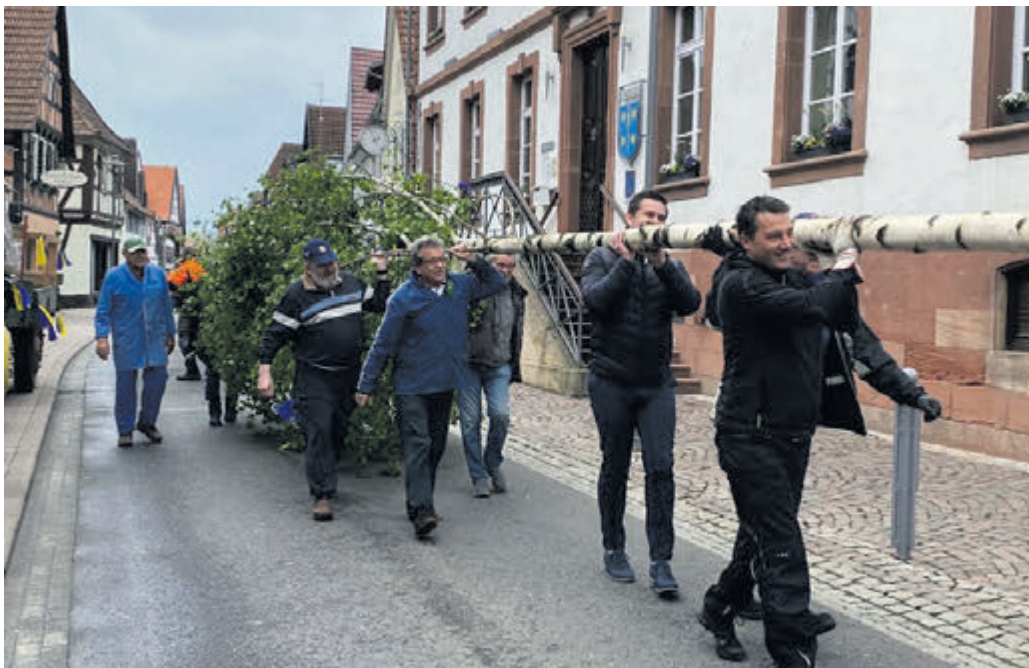
Der Maibaum als Symbol für Lebensfreude wird zum Rathausvorplatz getragen.

Das Aufrichten erfordert Kraft, Fingerspitzengefühl und Teamarbeit. Für diese Mühe werden sowohl die Akteure als auch die Gäste mit frischem Maibock belohnt, der auch in diesem Jahr von der Ottersheimer Bärenbrauerei gestiftet wurde. An die gesamte Bevölkerung ergeht herzliche Einladung! (wika)