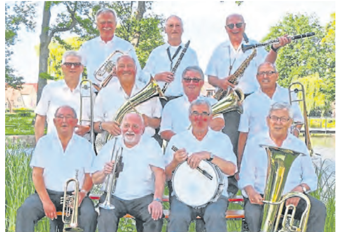
Bienwald Oldies spielen immer wieder gern in Kandel.