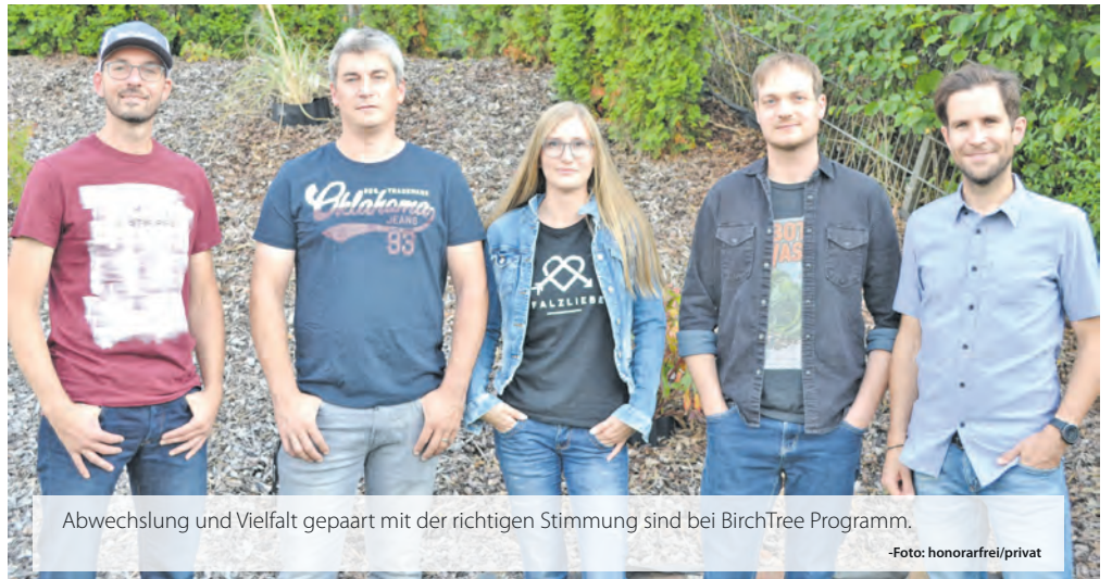
Abwechslung und Vielfalt gepaart mit der richtigen Stimmung sind bei BirchTree Programm.