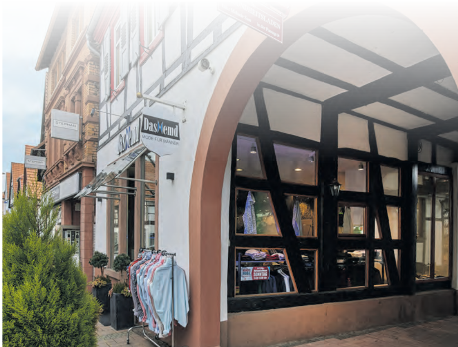
Das Hemd finden Sie in der Hauptstr. 92 in Kandel.

Nicht nur bei Einheimischen ist der Herrenausstatter beliebt, sondern auch bei Besuchern aus der Umgebung und darüber hinaus. Wer auf der Suche nach stilvoller Kleidung für besondere Anlässe oder den täglichen Bedarf ist, sollte hier unbedingt vorbeischaun. (wika)