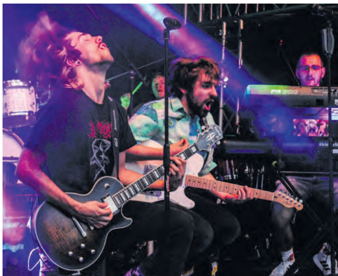
X-Rays rocken die Bühne im Festzelt.

Die Band, die euer Event unvergesslich macht. Mit ihrer kraftvollen Live-Performance heizen die X-Rays den Gästen des Oktobermarkts am Samstagabend ab 19 Uhr ordentlich ein und sorgen für unvergessliche Momente.