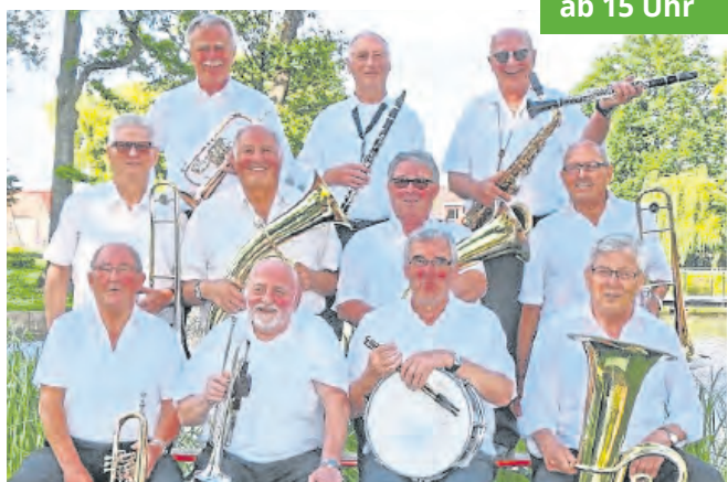
Bienwald Oldies spielen immer wieder gern in Kandel.