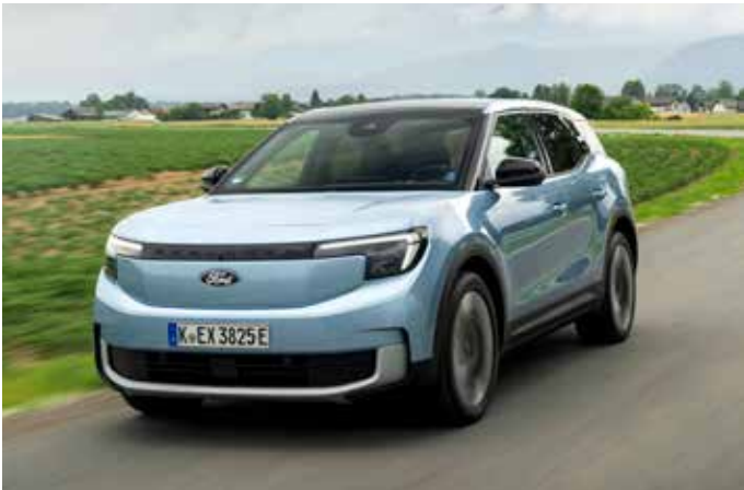
Der neue Ford Explorer.

Der vollelektrische SUV ist seit Dezember erhältlich