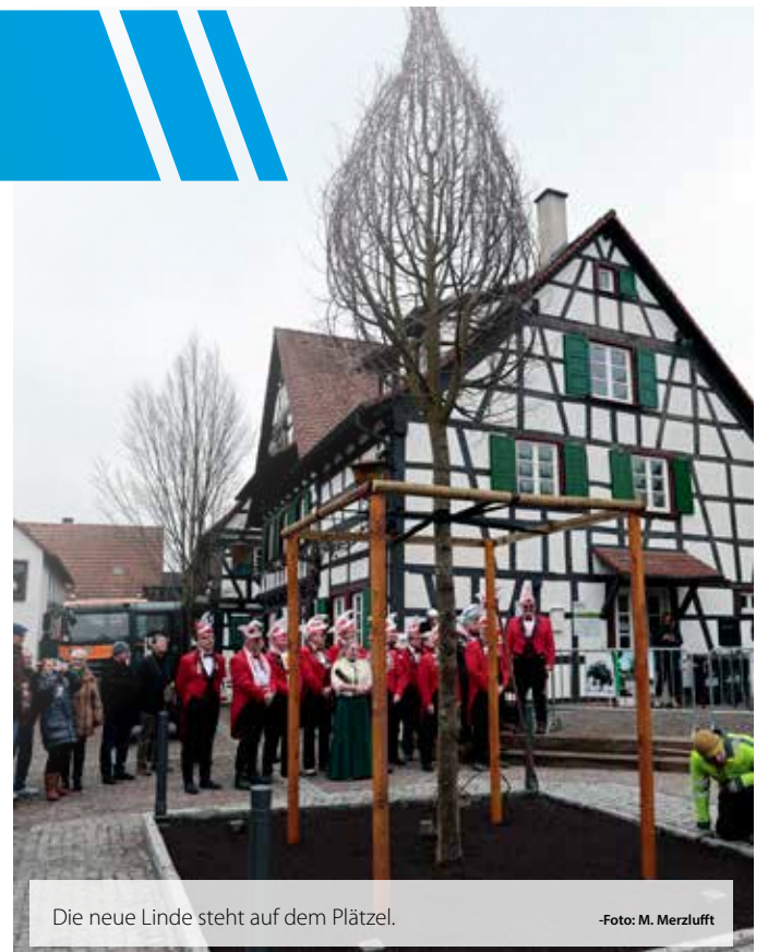
Die neue Linde steht auf dem Plätzel.

Zum Abschluss wurde die Linde mit Pfälzer Schorle getauft, und ein Bild des Künstlers Benjamin Burkhard für 1.444 Euro versteigert. Mit Karnevalsstimmung, Bewirtung und Musik wurde die Pflanzung gefeiert. (wika)