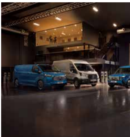
Ford Pro auf Rekordkurs.

Elektrifiziert in die Zukunft: 2025 wird jede Baureihe mindestens ein elektrifiziertes Modell bieten, darunter der vollelektrische E-Transit Courier und der Ranger PHEV, Europas erster Plug-in-Hybrid-Pick-up.