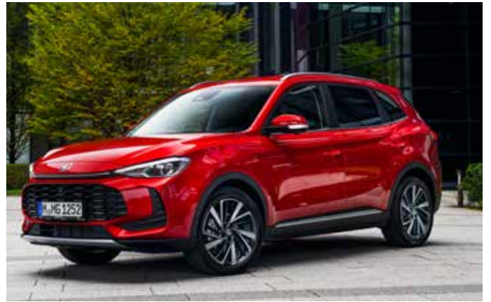
Dynamische Linien: Das ist der MG ZS Hybrid+.

Der MG ZS Hybrid+ erobert den Markt mit Stil und Innovation