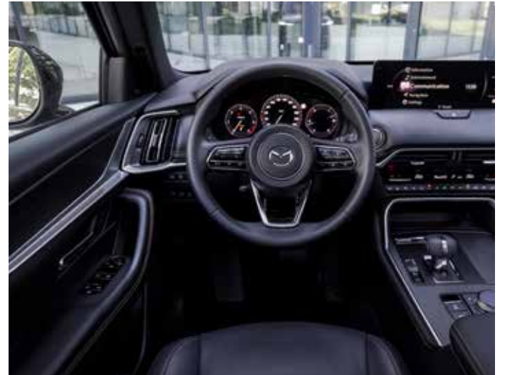
Mazda beweist Innovationskraft.