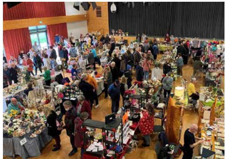
Der Ostereiermarkt in der Stadthalle und im großen Marktzelt lässt keine Wünsche offen.

Der Bauern- und Straßenmarkt auf dem Plätzel und in der Hauptstraße lädt mit über 30 Ständen zum Flanieren, Verweilen und Genießen ein. Besucher:innen können sich auf eine breite Auswahl an regionalen Spezialitäten freuen, die mit hoher Qualität und handwerklicher Tradition überzeugen. Dazu gehören frisch gebackenes Brot, erlesene Gewürze, hochwertige Öle, fangfrischer Fisch, aromatischer Honig und