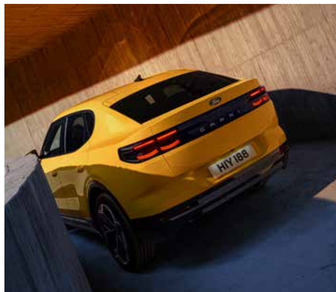
Moderne Fahrerassistenzsysteme sorgen für mehr Sicherheit.