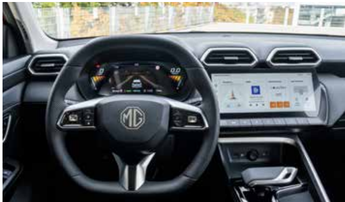
Das Innere des ZS Hybrid+ überzeugt mit hochmodernem digitalen Instrumentendisplay.

*Alle Preisangaben sind unverbindliche Preisempfehlungen der MG Motor Deutschland GmbH.