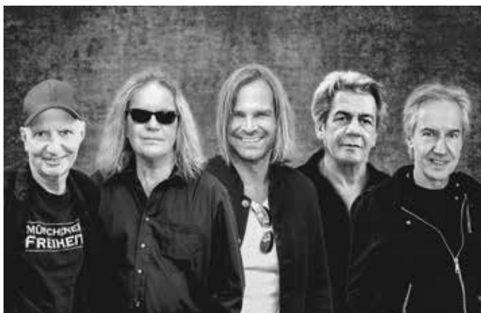
Münchener Freiheit: die Kultband der 80er Jahre kommt nach Kandel.