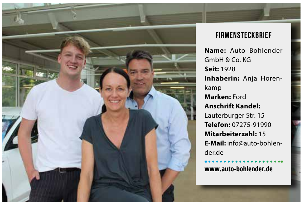
Familie Horenkamo heißt ihre Kunden herzlich willkommen.

Technisch setzt Ford auf eine leistungsstarke elektrische Antriebseinheit, die in verschiedenen Leistungsstufen erhältlich sein wird. Je nach Variante bietet der neue Capri bis zu 340 PS und ein maximales Drehmoment von 545 Nm, was für eine beeindruckende Beschleunigung sorgt. Die Reichweite beträgt je nach Akkukapazität zwischen 590 und 627 Kilometer nach WLTP-Standard. Dank der 800-Volt-Schnellladetechnologie lässt sich die Batterie in weniger als 30 Minuten auf 80 Prozent aufladen. Ein adaptives Fahrwerk mit mehreren Fahrmodi sorgt für ein optimales Fahrerlebnis, während ein tief liegender Schwerpunkt die sportliche Straßenlage verstärkt.