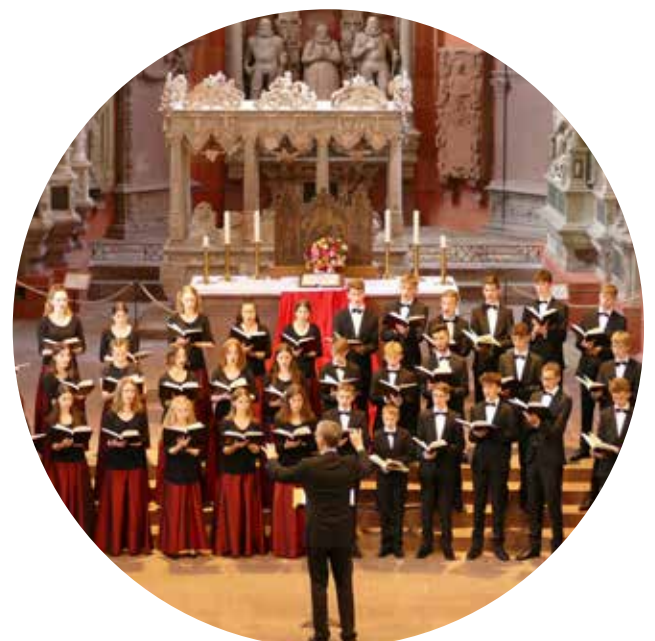
Der Chor ist bald in Kandel zu sehen.