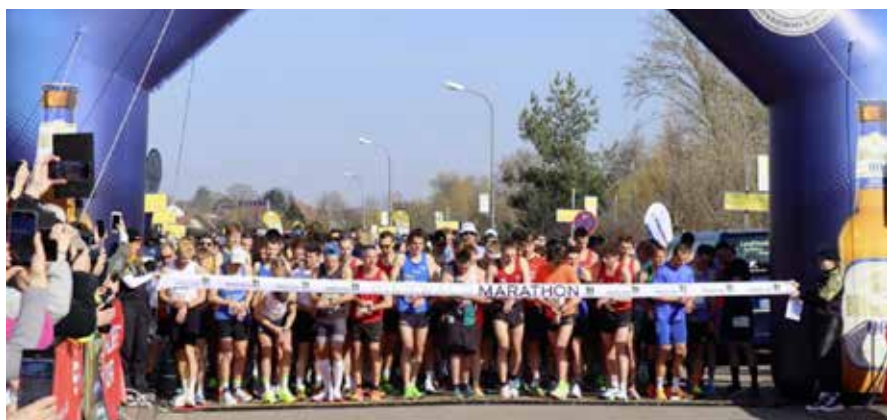
Start des 50. Bienwaldmarathon

Die Veranstaltung punktete mit familiärer Atmosphäre, neuer moderner Präsenz und einer erfolgreichen Pastaparty am Vorabend. Ein voller Erfolg – mit Blick auf die nächsten 50 Jahre! (wika)