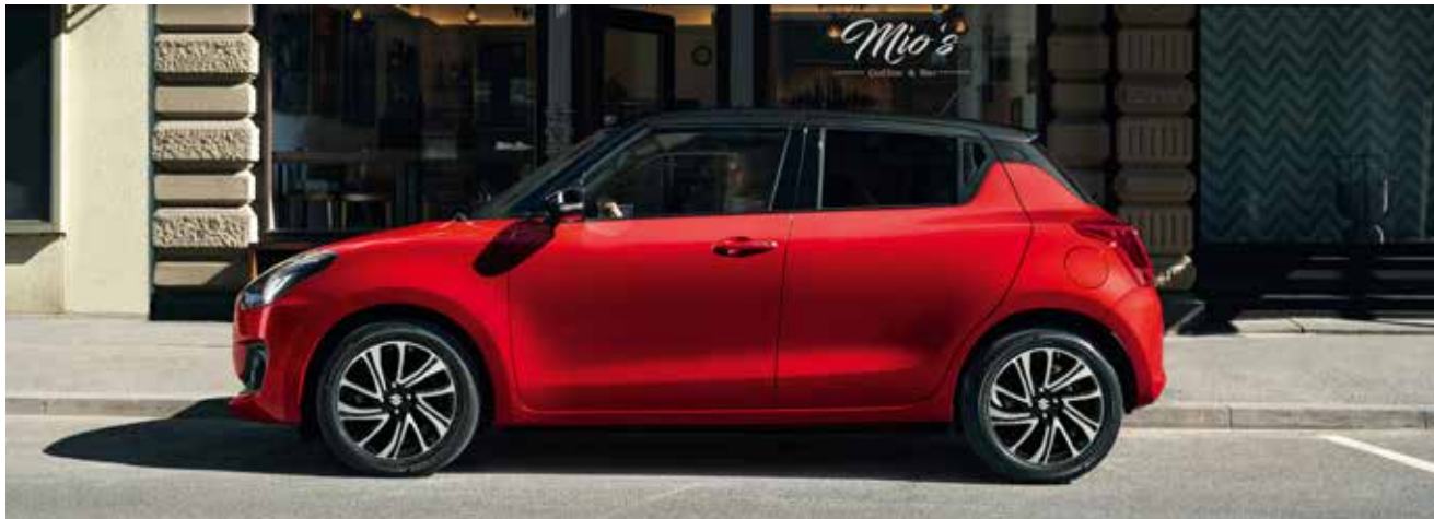
Mehr Fahrspaß und Sicherheit dank intelligentem Allradantrieb, modernster Ausstattung und effizientem Motor.

Mehr Antriebsvielfalt für noch mehr Fahrspaß