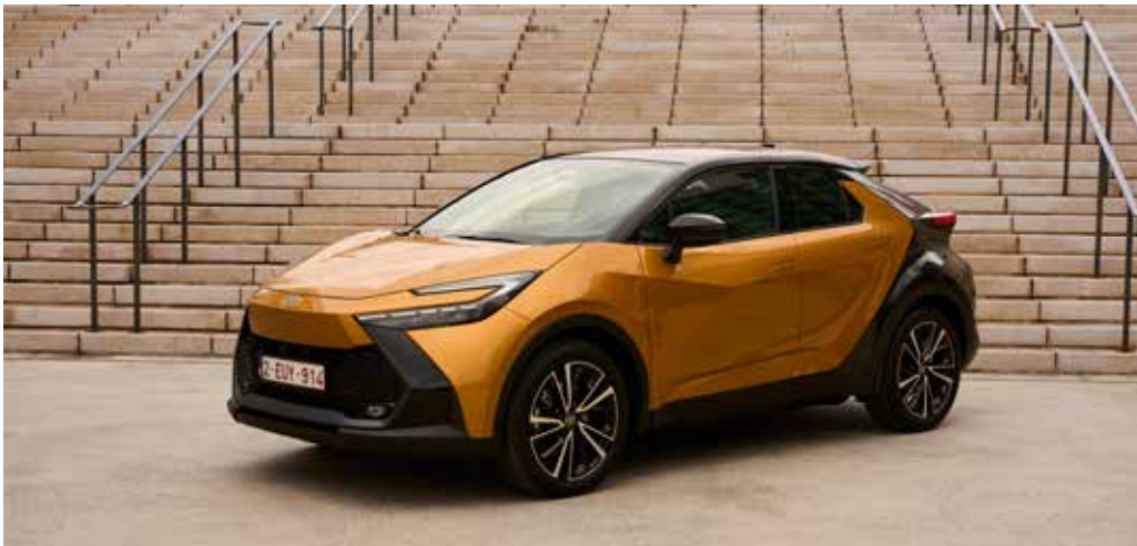
Der neue Toyota C-HR.

Innovatives Design trifft auf Nachhaltigkeit