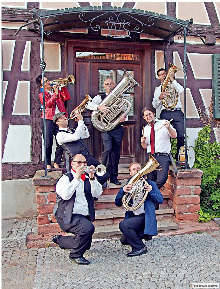
Foto: Brazzo Septimo

Brazzo Septimo schließen das Programm am Sonntag, 4. Januar